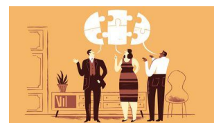
Průvodce gentlemana na cestě k nesouhlasu

A jak o tom komunikovat, aby zprávy spojovaly a povzbuzovaly?