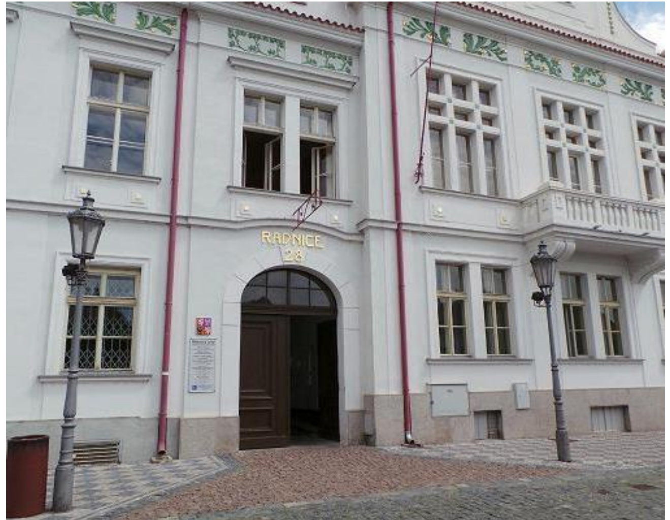
Městský úřad Brandýs nad Labem – Stará Boleslav Mariánské nám. 28/10

Dle našeho šetření, ne všichni klienti mají o tyto služby zájem.